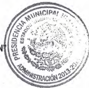
C. JESUS MANUEL GUERRERO GAMBOA. PRESIDENTE MUNICIPAL

ATENTAMENTE "SUFRAGIO EFECTIVO NO REELECCIÓN"